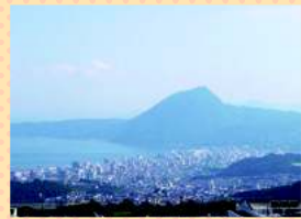
別府湾サービスエリア