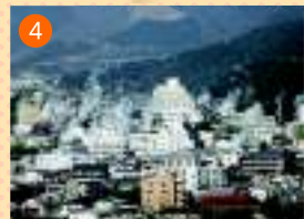
鉄輪(かななわ)温泉